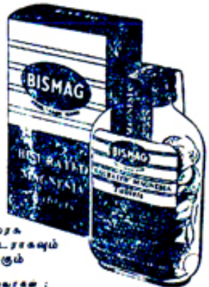
மாத்திரைகள் எக்கவும் பவுடராகவும் கிடைக்கும்

‘பிஸ்மாக்’ தடினமே அறிர்னத்தைப் போக்குகிறது